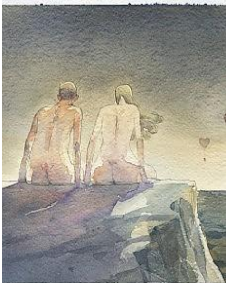
Immagine di Gipi